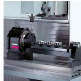
Dreifachspannung auf Wippe