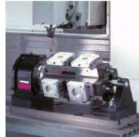
Spannung mit 8 Teilen